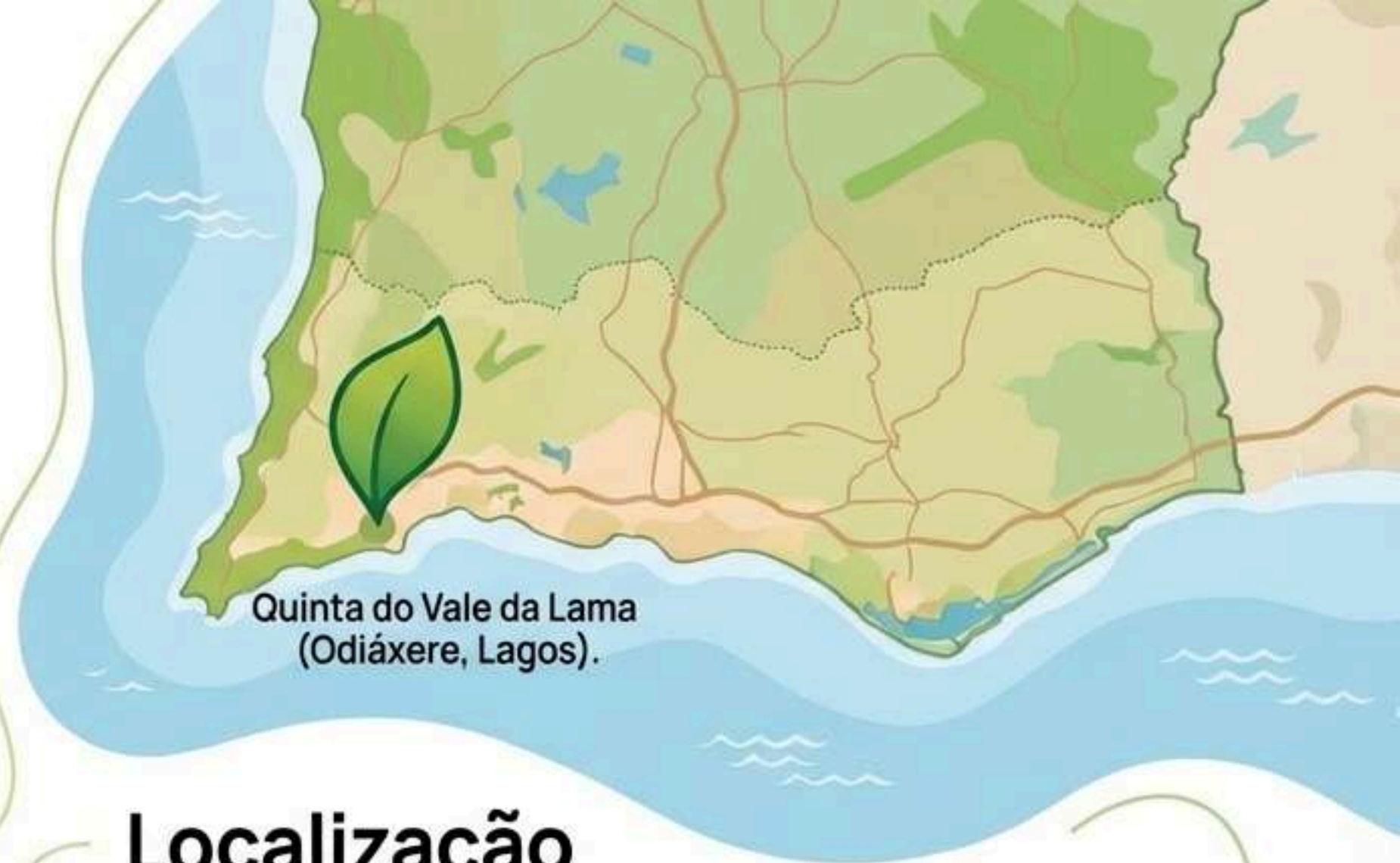
Quinta do Vale da Lama (Odiáxere, Lagos).

Nota: As atividades podem ocorrer noutros locais (escolas, parceiros) quando estrategicamente vantajoso.